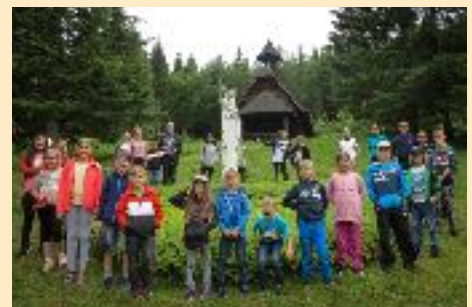
unten: Das diesjährige Kindersommerlager fand in Talhof am Semmering statt. Abseits der Zivilisation hatten die Kinder großen Freude an den gemeinsamen Aktivitäten. P. Erich feierte täglich mit den Kindern die Heilige Messe.