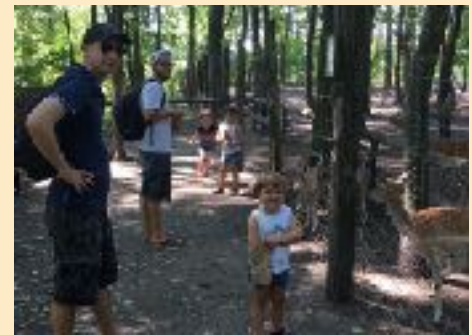
oben: Ausflug der Domküken. Nach dem Familiengottesdienst mit P. Achim besuchten die Familien den Steppentierpark Pamhagen.