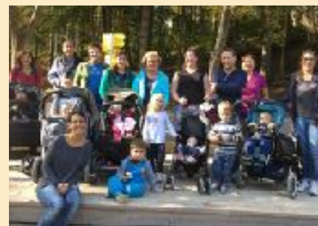
unten: Im Oktober besuchten einige Familien der Domküken gemeinsam den Naturpark Sporbach