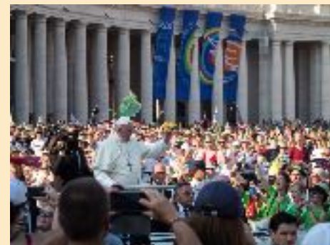
oben: Die Eisenstädter Ministranten in Rom freuten sich besonders über die Begegnung mit Papst Franziskus am Petersplatz.